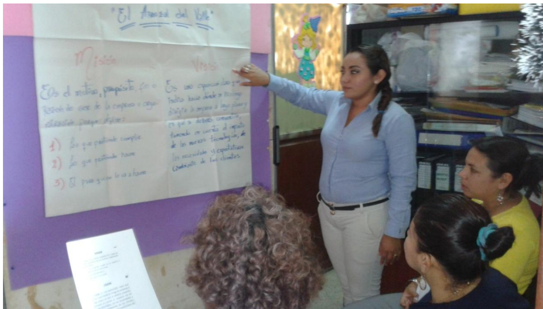
Foto N°2: Taller con socios y directivos de la Asociación de arroceros “ARROZAL DEL VALLE”. (Diagnóstico y direccionamiento estratégico).