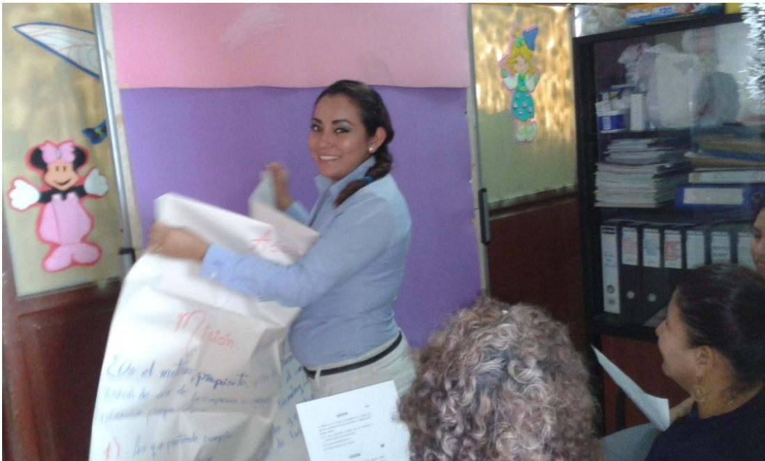
Foto N° 4: Taller con socios y directivos de la Asociación de arroceros “ARROZAL DEL VALLE”. (Diagnóstico y direccionamiento estratégico)