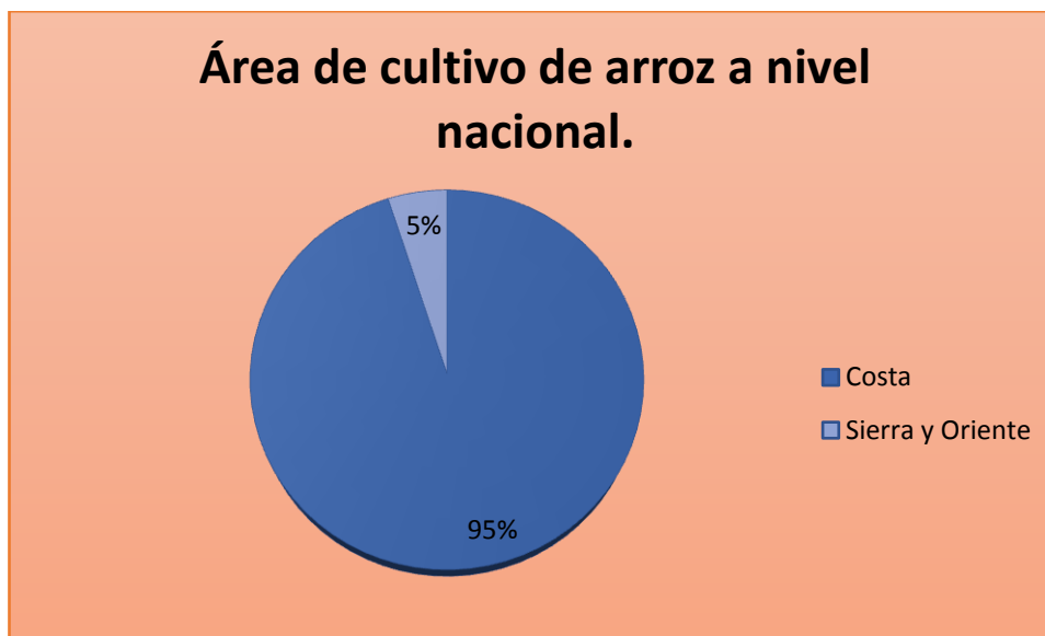
Gráfico No. 1

Gráfico N°1. Distribución de los cultivos de arroz a nivel nacional.