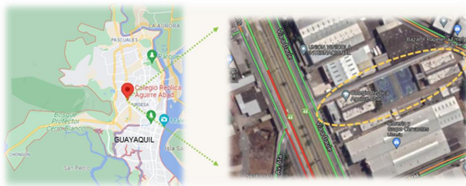
Figura 1 Ubicación del colegio

Nota. Ubicación de la institución educativa - Colegio Réplica Aguirre Abad