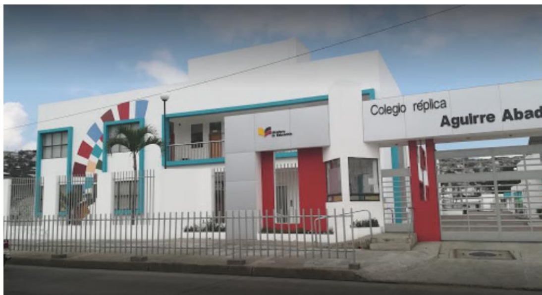
Figura 2 Ingreso al colegio

Nota. Fachada de la institución educativa - Colegio Réplica Aguirre Abad donde se puede apreciar la poca vegetación existente en el plantel. 2018