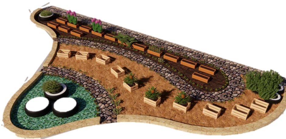
Figura 7 Diseñar espacios que generen confort y sean agradables visualmente