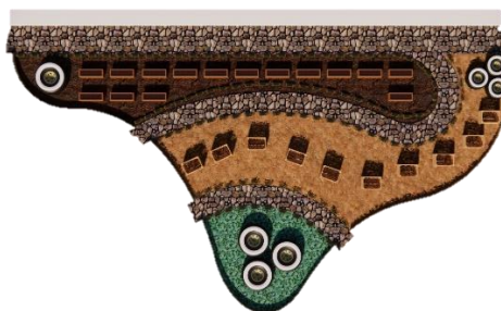
Figura 6 Diseñar espacios que generen confort y sean agradables visualmente