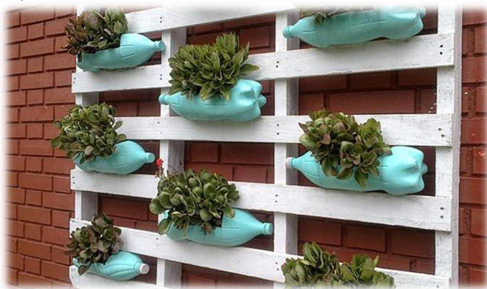
Figura 5 Jardín vertical fabricado con materiales reciclable.

Nota. Jardín verticales creado con botellas de plástico