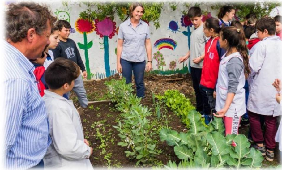
Figura 8 Huertas escolares - cuidado del medio ambiente

Nota. Clases prácticas sobre el cuidado del medio ambiente Tomado de