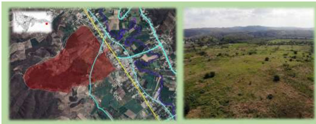
Imagen 2: Identificación de Terreno en

fuente elaboración propia a partir de imagen del Google Earth y archivo fotográfico personal.