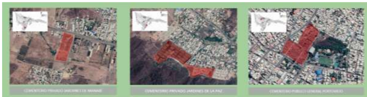
Imagen 1: Identificación de Cementerios públicos y Privados,

En esta etapa se recolectó información por medio de insumos como mapas, datos de ubicación georreferenciadas y usos de suelo.