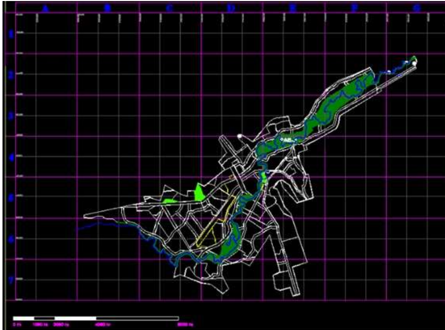
Anexo 2: Mapa de protección ambiental ecológica de la ciudad de Portoviejo